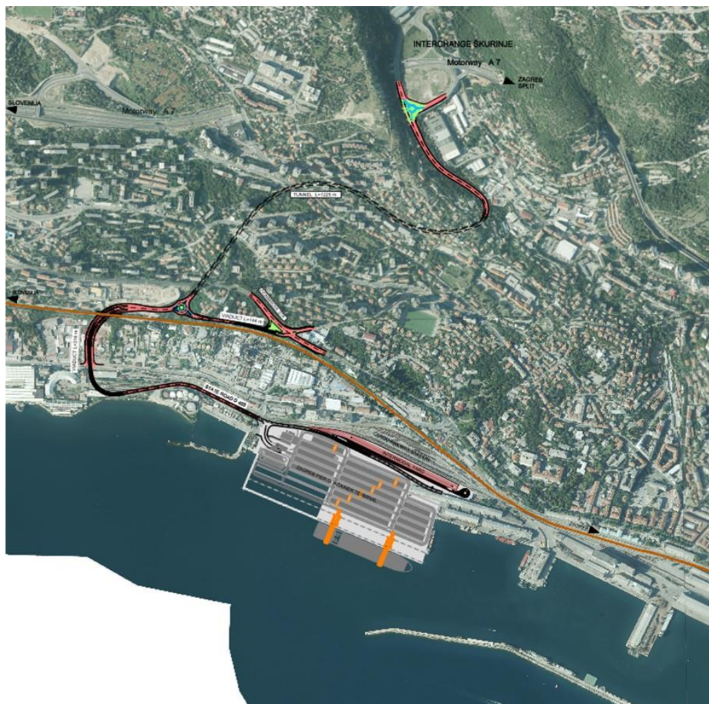
Slika 1. Zagreb Deep Sea kontejnerski terminal i državna cesta DC 403

Radovi na izgradnji ceste DC 403 teku prema planu. Lučka uprava Rijeka je sukladno traženju Koncesionara dostavila Hrvatskim cestama zahtjev da se na posljednjoj dionici ceste predvidi još jedna traka kako bi se osigurao prostor za kamione koji čekaju na ulazu u terminal. Hrvatske ceste su tijekom 2022. dopunile projektno rješenje sukladno traženju koncesionara.