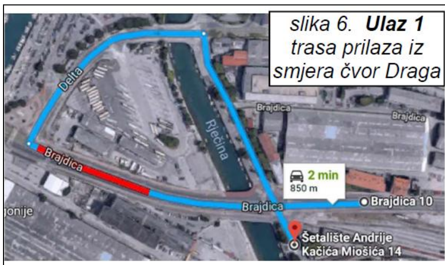
Slika Ulaz 1.

Zbog izvođenja radova na kontejnerskom terminalu Brajdica i željezničkom kolodvoru Rijeka-Brajdica biti će pojačan promet kamiona i drugih vozila na prilaznim prometnicama. U vrijeme izvođenja radova gradilišni priključci nalaze se na lokacijama ULAZ 1, 2, 3 kako je prikazano na slikama u nastavku. Intenzitet korištenja pojedinih prilaza ovisit će o dinamici izvođenja radova. Izvođač može povremeno pojedine prilaze i zatvoriti, ali privremena prometna signalizacija će ostati cijelo vrijeme tijekom izvođenja radova u projektu.