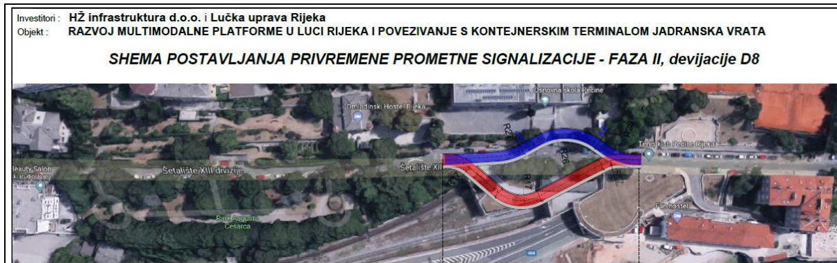
Slika 1. Privremeno izmještanje (devijacija) u ulici Šetalište XIII divizije

Postojeće autobusno stajalište Pećine bit će izmješteno na novu lokaciju ispred zgrade u ulici Šetalište XIII. divizije 30, što je udaljeno do 35 m od privremenog pješačkog prijelaza.